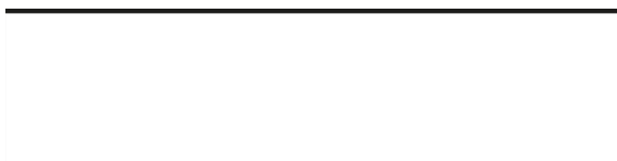
30x120 cm Rett. 12"x48" Rect. \approx 20 mm R11